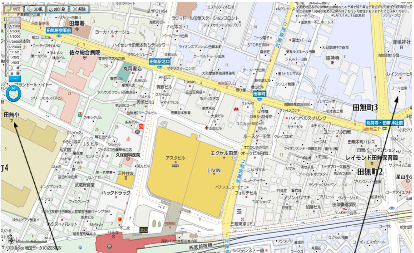
最終避難場所 田無小学校