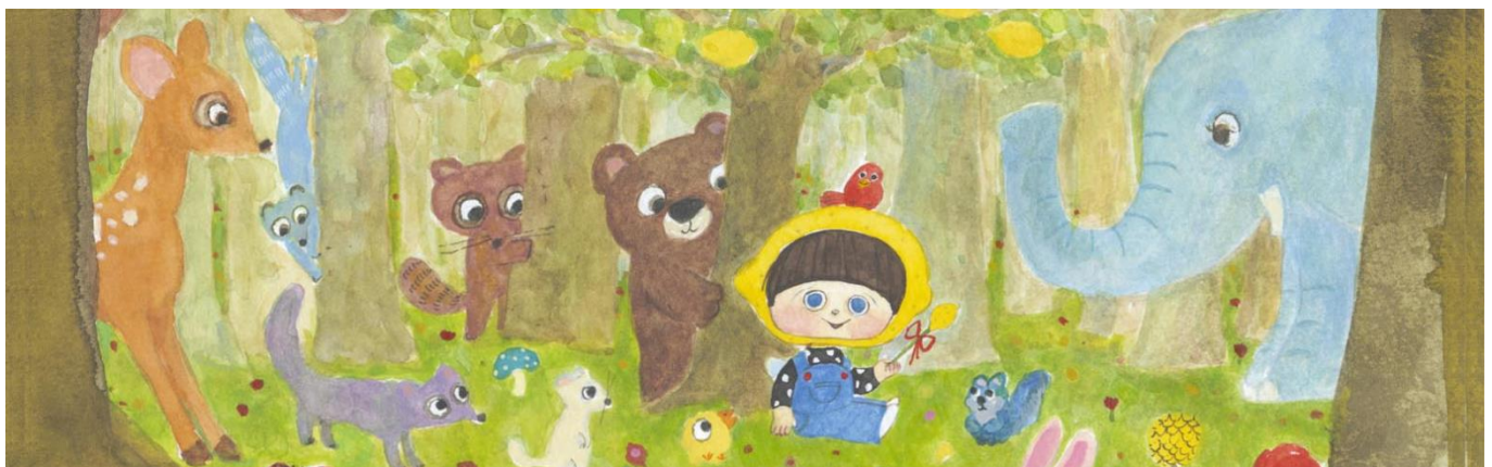
レイモンドちゃん