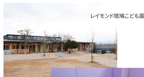
レイモンド斑鳩こども園

レイモンド斑鳩こども園（奈良県生駒郡斑鳩町）、レイモンド平群こども園（奈良県生駒郡平群町） レイモンド甲賀こども園（滋賀県甲賀市）、レイモンドみらい園（滋賀県大津市）