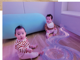
センサリールーム 「あるがまま」